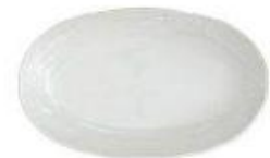
Fuente Rectangular 34 x 23 cm