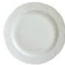
Plato Llano Ø 27cm