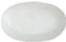
Fuente Oval Ø 33cm