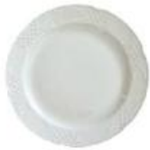
Plato Llano Ø 30cm